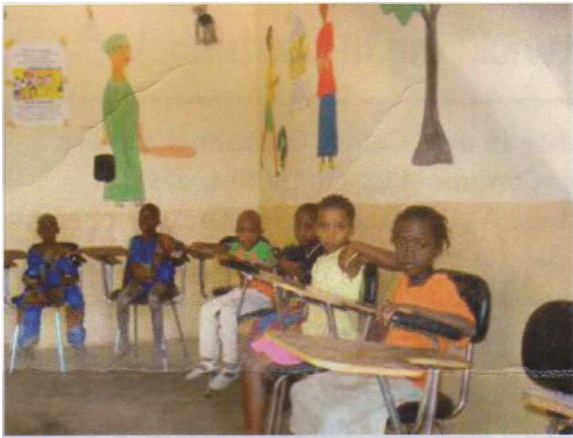
Unterricht im Kindergarten der Gemeinde

Möglichkeit, etwas über den Nährwert von verschiedenen Nahrungsmitteln zu lernen, und sie lernen auch, wie sie durch deren Kombination ihre Ernährung verbessern können.“ Er ergänzt: „In diesem Jahr wurden die Kinder beim Gemüseanbau unterstützt und es gab eine reiche Ernte.“ Da die meisten Kinder drei Kilometer zur Schule laufen, oft ohne zu essen, wird solch ein Ertrag dazu beitragen, mehr Abwechslung in die Mahlzeiten in den Schulkantinen zu bringen und die Kinder in der Schule zu halten.