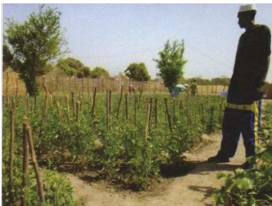
Ein Lehrer prüft den Gemüsegarten seiner Schüler

Schulausrüstung transportiert habe, wurde vom Füller oder Stift zerrissen. Wenn ich gespendete Schulmaterialien erhielt und sie nach Hause trug, fiel auf dem Weg etwas heraus und konnte manchmal nicht ersetzt werden. Meine Freundin und ich freuen uns, eine Schultasche mit Material zu bekommen, denn das sind unter anderem genau die Sachen, die wir brauchen, um weiter die Schule zu besuchen und eines Tages unsere Träume erfüllen zu können.“