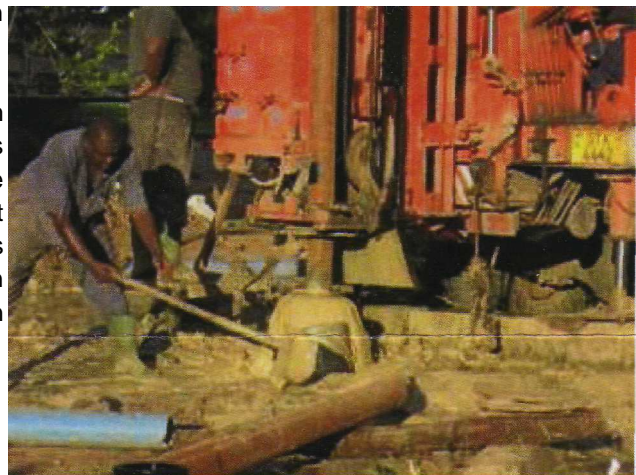
Arbeiter einer Wasserbohrfirma bauen einen Bohrbrunnen an einer unserer Schulen.

Außerdem haben sich unsere Eltern gemeinsam entschieden, Sparkonten mit Einlagen von mindestens 100 $ zu eröffnen, um Geld zu sparen, damit wir die Bohrbrunnen reparieren können, wenn sie einmal kaputt gehen. So können wir auch die Nachhaltigkeit des Projekts gewährleisten. Wir zuversichtlich, dass wir nun dauerhaft sauberes Wasser in unserem Gebiet trauen werden.