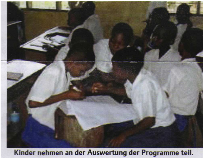
Kinder nehmen an der Auswertung der Programme teil.

Dies ist eine aktuelle Beschreibung über das Leben in dem Gebiet Lumemo aus der Sicht der Kinder und Familien, die dort leben. Lumemo ist ein Gebiet, das aus mehreren Gemeinden besteht. Die Situation und Aktivitäten, die hier beschrieben werden, stehen stellvertretend für das ganze Gebiet.